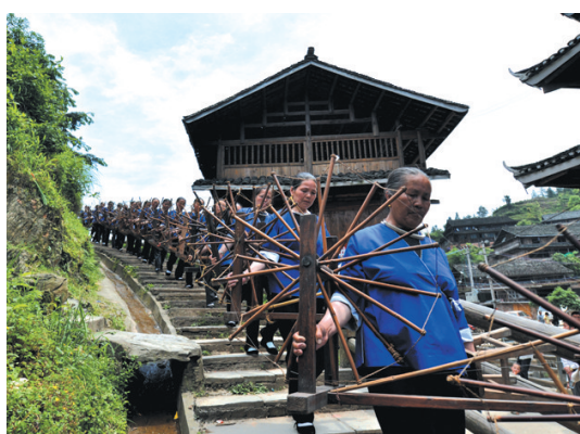
▲侗族妇女带着纺车入场。