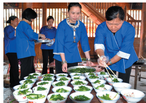
▲韭菜油茶,香飘万家。