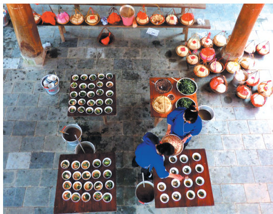
▲侗族妇女在鼓楼打韭菜油茶。

5月2日,三江侗族自治县林溪乡高友村举办一年一度的“文化林溪”韭菜节暨特色农产品宣传推介活动,以田间抓鱼、山上采茶、园内割韭等农耕文化体验,芦笙、多耶、纺纱、百家宴、行歌坐夜等民族文化展演,以及韭菜擂台赛、特色农产品展销等多彩节目上演最炫民族风,吸引中外近万名游客前来狂欢。