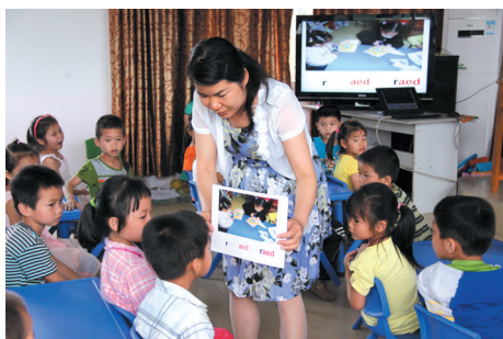
▲图文并茂的卡片展示吸引了小朋友的学习兴趣。