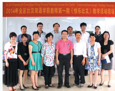
▲参加培训班的领导、专家和实践教师合影。