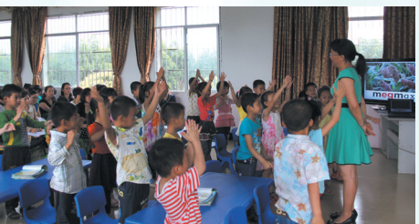
▲幼儿园的小朋友踊跃参与课堂活动。