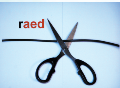
▲多媒体展示让壮文教学更形象。

此次培训除了跟班研修外，还采取分组研讨、专家点评、专题讲座等灵活多样的培训方式，力求让参加培训的学员学有所成、学有所用。