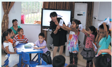
▲字母游戏让教学充满趣味。