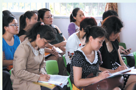
▲参加培训的学员认真听讲和做笔记。