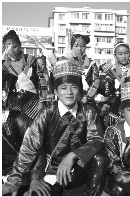
▲盛装的红瑶小伙子正面图。

融水红瑶人人爱美,男女皆然。仅仅说男士装扮,就令人“眼花缭乱”:头饰、上衣、裤子与裤带与众不同,还有电筒背带、烟斗银饰品、布鞋和草鞋、随身小口袋等也美不胜收。