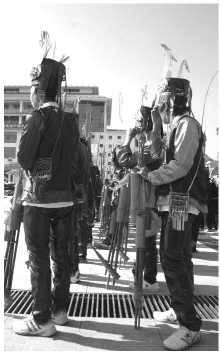
▲盛装的红瑶小伙子侧面图。

读书能够提高人的智慧,故唐代诗圣杜甫有诗云:“读书破万卷,下笔如有神。”它强调了读书对人的智慧有着重要的作用。而就读书能提高人的智慧问题,现代的鲁迅先生也曾说过:“必须如蜜蜂一样,采过许多花,才能酿出蜜来,倘若叮在一处,所得就非常有限枯燥了。”鲁迅先生的论说与杜甫诗圣的诗句有着同工之处,都在于说明,要多读书且必须广泛,所读书籍多了广泛了,才能获得更多的知识。杜甫“读书破万卷”的诗句和鲁迅读书要广泛的论说,对我们是非常有用的。故我们在安排自己的业余时间时,应该把读书安排进去,多看书才能增加自己的知识面。切记,不要希望自己看书以后所得的知识马上得到提高,知识的提高是无形而慢慢提高的,自己一时半会也感觉不出来。然而书看多了,有用的知识就自然会慢慢地潜移默化地融入我们的脑海,从而成为我们的智慧。如是而言,获得知识,必须多看,看好书,故有闲时间不看书,也就显得太可惜了。