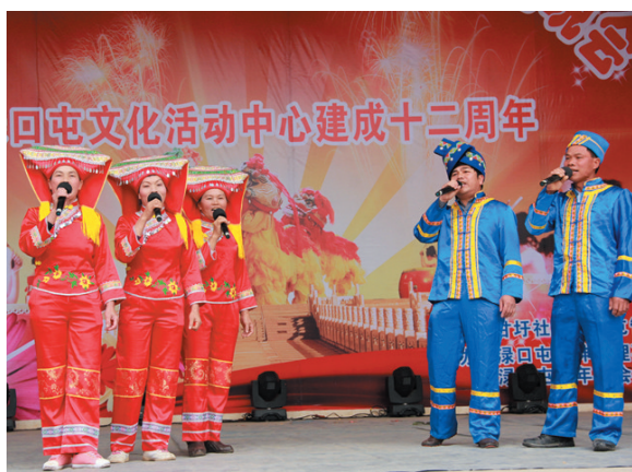
▲淶口屯举行文化活动中心建成十二周年庆典上的山歌对唱。