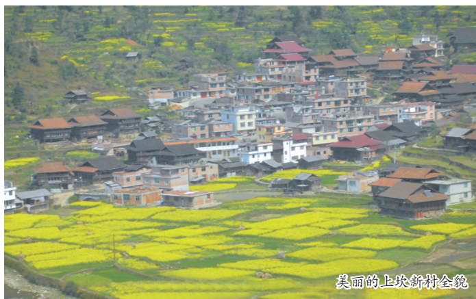
美丽的上坎新村全貌

县成立60周年，按照中央和自治区的部署要求，在各级各有关部门的大力发展支持下，2012年以来自治县实施了安太至红水公路、古豆至龙岸（融水段）公路等10条通村水泥混凝土路面工程，项目总里程151.1公里，总投资12899万元。安太—红水道路硬化工程，路经培地5公里，利用这个历史性机遇，村“两委”多方面筹资，及时对通屯道路进行全面硬化。在乡级主干道的促进下，目前培地村沿路两旁，建起了一排排临街洋房，城镇化发展新时代已悄然进入苗山深处。