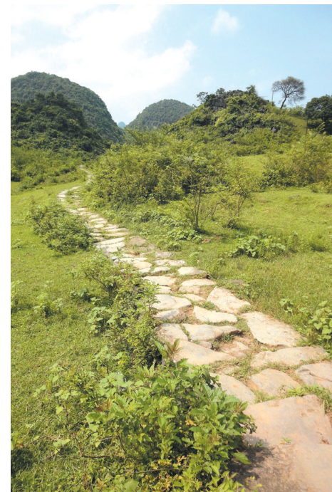
▲蜿蜒前行的穿岩古道。