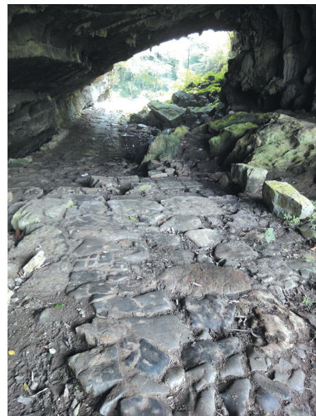
▲穿岩古道历经沧桑，见证无数世态炎凉。

桂林市永福县境内的百寿古镇，别有洞天：群峰林立，景色秀丽，山环水绕，历史悠久，文化厚重。镇区内的“百寿图”和永宁州古城，今年5月荣升为全国重点文物保护单位。