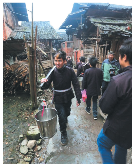
▲上午,村寨的小伙子组成“讨酒”队,挨家到邻村姑娘家中“讨酒”。

“文革”期间,“月地瓦”活动停办,后又经历了1982年复办和1996年停办,2008年复办到今。近几年,通道侗族自治县上岩村和坪寨村每年都要举行盛大的“月地瓦”活动,增添节日喜庆气氛,为村寨的男女青年谈情说爱、婚恋娶提供平台。“月地瓦”演变成侗家的“情人节”。近年,通过这一活动,两个村寨每年都有10多对有情人走到了一起。