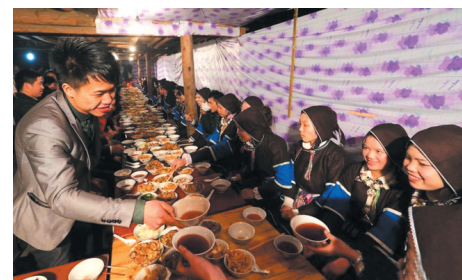
▲20时,合拢宴上,小伙给中意的姑娘敬酒。