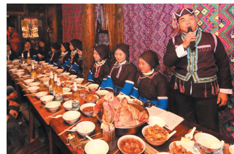
▲19时30分许,合拢宴上,寨子里的寨老给大家“讲款”。