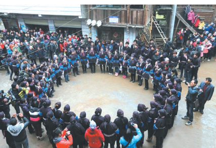
▲16时20分,坪寨村的长者吹起自制芦笙,欢迎上岩村的姑娘们。