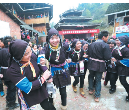
▲出发前,姑娘们唱起“哆地”跳起舞,小伙子们不时对上几句进行“调侃”。

▲上午11时,寂静的寨子里开始热闹起来。上岩和坪寨的小伙子们成群结队,身着盛装,一路放着鞭炮,挑着水桶到对方村子,挨家逐户到姑娘家里“讨酒”,邀请她们参加本村的“月地瓦”活动。图为第一次参加“月地瓦”的侗家阿妹既兴奋期待又有些害羞。