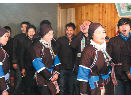
▲“哆地”后抢姑娘是最激动人心的时刻。